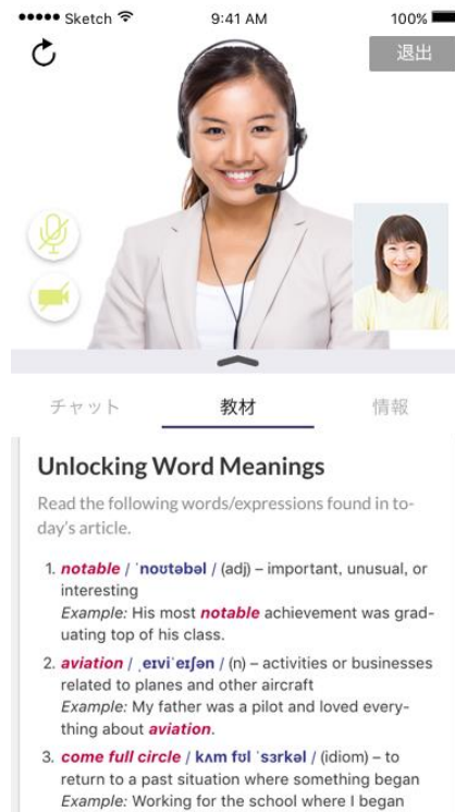
レアジョブ英会話アプリの画面イメージ

レアジョブ英会話アプリは今まで予約専用アプリでしたが、「レッスンルーム」であればアプリ内でレッスンが受講できるようになりました。教材の文字も見やすく、気軽にスマートフォンでレッスンが受講いただけます。